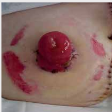
Poškodba parastomalne kože zaradi medicinskih lepilnih trakov in obližev (PMARSI)

Če dobrega prileganja s kožno podlogo ni mogoče doseči, se posvetujte z medicinsko sestro enterostomalno terapevtko.