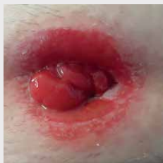
Poškodba parastomalne kože zaradi vlažnosti (PMSAD)