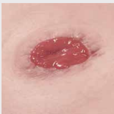
Stoma v nivoju kože (»flush« stoma)