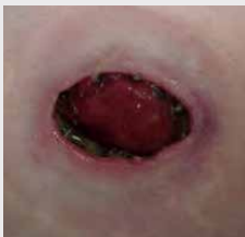
Mukokutana separacija/ dehiscenca stika stome s kožo

Odstopanje tkiva stome od parastomalne kože. 2